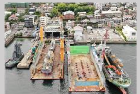
【シンナガ(修繕ドック)】