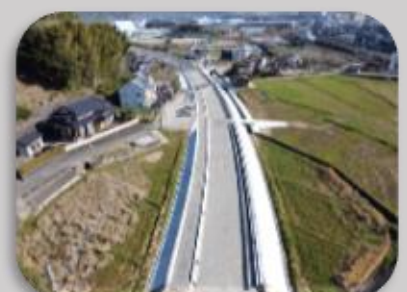
一般県道久山港線道路改良工事（1工区）