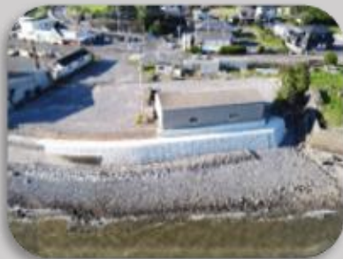
小長井港平原護岸災害復旧工事