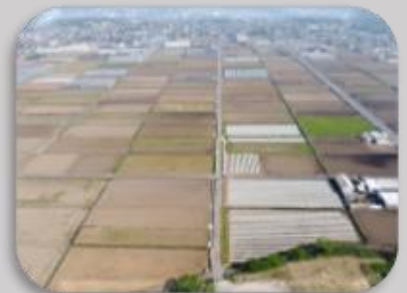
宇良田井原地区用水路工事