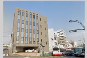
【西州建設本社(有明ビル)】