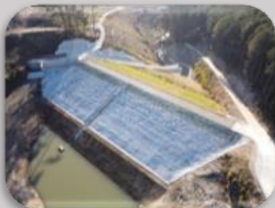
大村北部地区城田ため池付帯工事