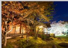
【原鶴温泉観光ホテル小野屋】