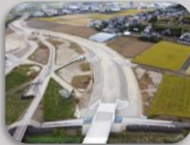
一般県道諫早外環状線道路改良工事（盛土工7）