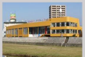
【諫早パークレーン】