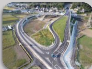
一般県道諫早外環状線道路改良工事（側道工14）